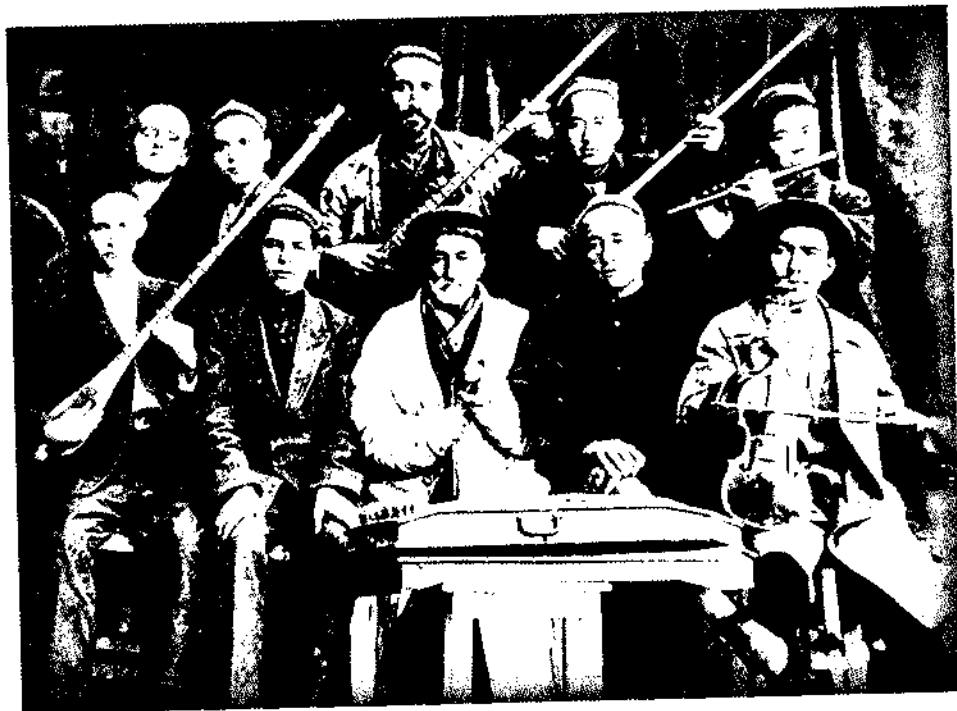
Ҳожи Абдулазиз Абдурасулов ва унинг тошкентлик шогирдлари ҳамда мухлислари.

Ҳозиргача устоз ижросидаги ўнга яқин грамофон пластинкалари рўйхатга олинган: «Ироқ», «Кўқон ушшоғи», «Насруллоий», «Чапандози Наво», «Мустазод», «Чапандози Гулёр», «Бебоқча», «Бозургоний», «Дўст Худойим» (кейинги номи «Гулизорим»). Буюк санъаткордан қолган бу овоз ёзувлари классик мусиқа ижросининг юксак намунаси ҳамда яқин тарихни ўрганишда бебаҳо ҳужжат бўлиб хизмат қилади.